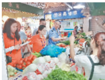
工作人员在农贸市场检测农产品

通过前期的改造提升，越城区目前已建成省级农村家宴“放心厨房”50家、区内A级标准化家宴中心40家，落实奖补资金84万元，工作成果在国家食品安全示范城市中期评估检查中得到充分肯定。