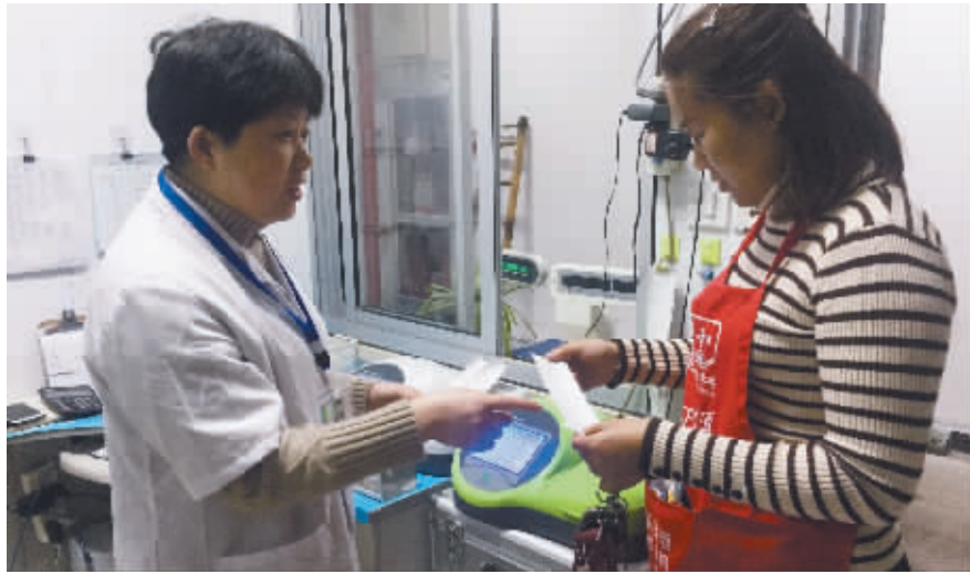
快速检测室正在检测市民购买的蔬菜农药残留情况。

据越城区市场监管局有关负责人介绍,从 10 月 15 日起全区同步启动快速检测系统,“免费快检室”目前已覆盖全区 24